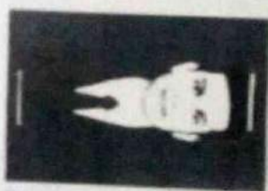
Tandatangan Pencari Kerja