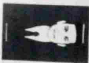
Tandatangan Pencari kerja

Diterima di : Terbilang mudi Terbilang :