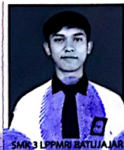
SMK 3 LPPM RI BATUJAJAR

dari sekolah menengah kejuruan setelah memenuhi seluruh kriteria sesuai dengan peraturan perundang-undangan.