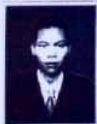
Judul Tugas Akhir Final Report Title

: PENGARUH MOTIVASI KERJA TERHADAP KINERJA PEGAWAI PADA KANTOR PELAYANAN KEKAYAAN NEGARA (KPKN) BANDUNG EFFECT OF WORK MOTIVATION ON THE EMPLOYEES PERFORMANCE AT KANTOR PELAYANAN KEKAYAAN NEGARA DAN LELANG (KPKN) BANDUNG