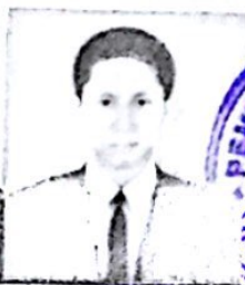
SMK NEGERI 6 BANDUNG