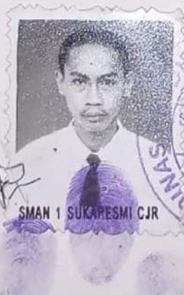
SMAN 1 SUKAPRESMI CJR

Ujian Sekolah dan Ujian Nasional berdasarkan Surat Keputusan Kepala Dinas Pendidikan Provinsi Jawa Barat NO. 423.7/Kep. 1286-BP/2005 tanggal 18 April 2005