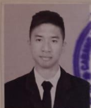
SMK NEGERI 1 KATAPANG

dari sekolah menengah kejuruan setelah memenuhi seluruh kriteria sesuai dengan peraturan perundang-undangan.