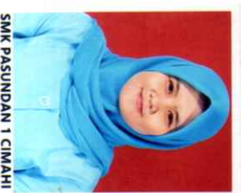
SMK PASUNDAN 1 CIMAH