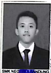
SMK NEGERI 6 BANDUNG

dari satuan pendidikan setelah memenuhi seluruh kriteria sesuai dengan peraturan perundang-undangan.