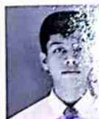
SMKN 1 CIPONGKOR