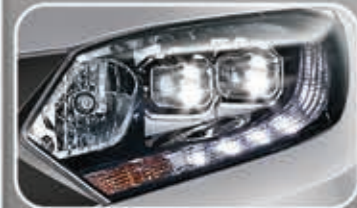
LED Projector Headlight with LED Daytime Running Light