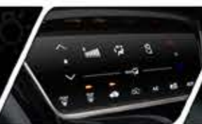
AUTO A/C WITH SMART TOUCH