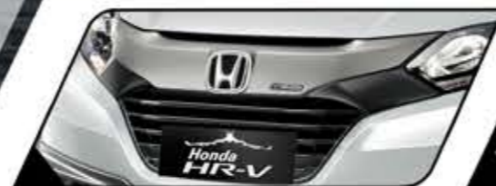
SPORTY FRONT GRILLE