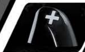
PADDLE SHIFT WITH 7-SPEED MODE