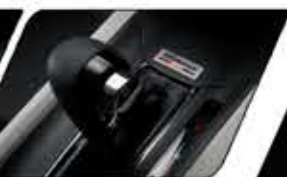
CVT WITH EARTH DREAMS TECHNOLOGY