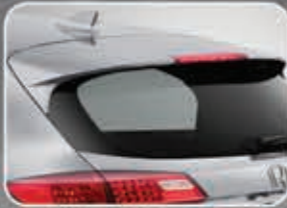
Sporty Tailgate Spoiler with LED High Mount Stop Lamp