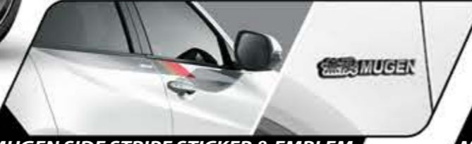
MUGEN SIDE STRIPE STICKER & EMBLEM