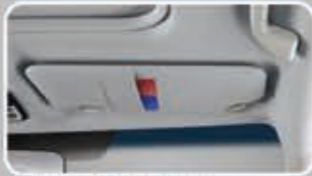
Sun Visor with Ticket Holder