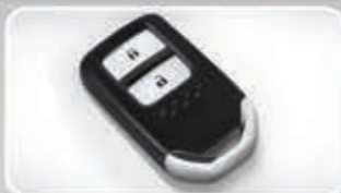
Smart Entry System with Keyless Entry (Tipe E & 1.8L Prestige)