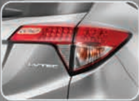
Rear Combination Lamp with LED Stop Lamp