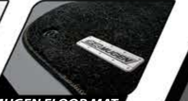
MUGEN FLOOR MAT