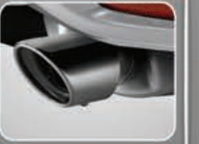
Chrome Exhaust Pipe Finisher