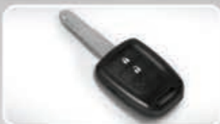
Wave Key System with Keyless Entry (Tipe S)