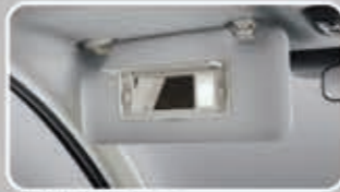
Vanity Mirror with Lamp