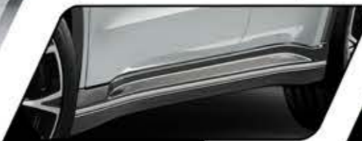
SIDE UNDER SPOILER