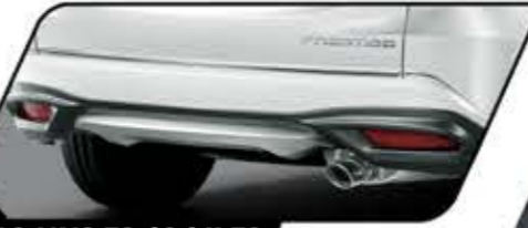
REAR UNDER SPOILER