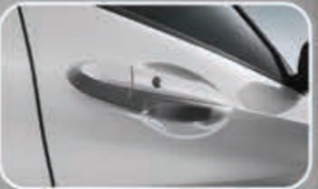
Smart Entry System