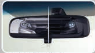
Day/Night Rear View Mirror