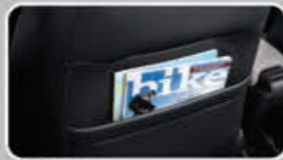
Seat Back Pocket