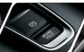
ELECTRIC PARKING BRAKE & AUTO BRAKE HOLD