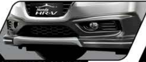
FRONT UNDER SPOILER