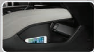
Front Console Pocket