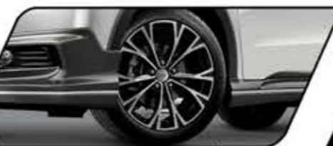
TOUGH 17" ALLOY WHEELS