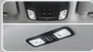
LED Front Map Lamp & LED Room Lamp