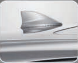
Shark Fin Antenna