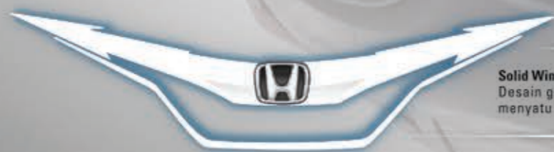
Solid Wing Face Desain grille dan lampu di bagian depan yang menyatu memberikan kesan maskulin.

Eksterior Honda HR-V hadir dengan konsep dynamic cross solid yang menggabungkan unsur atraktif serta aerodinamis dari sebuah coupe , ditambah kekuatan dari sebuah SUV. Hasilnya adalah sebuah eksterior dengan tampilan seductive .