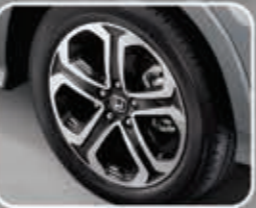
Bold 17" Alloy Wheels