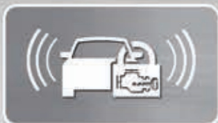
Alarm System (Tipe S, E & 1.8L Prestige)