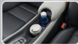
Center Drink Holder