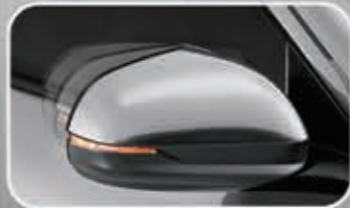
Power Retractable Door Mirror with LED Turning Signal